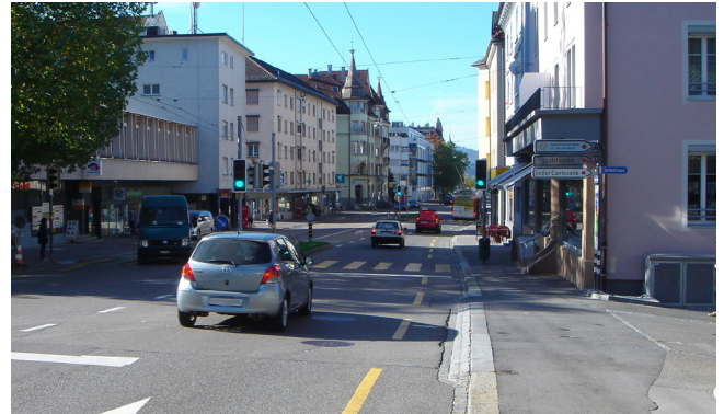
Fig. 1 : L'espace-rue, d'une façade à l'autre, doit répondre aux multiples besoins de ses usagers (Zürcherstrasse à Saint-Gall)

À quels besoins et exigences l'espace-rue se doit-il de répondre ? Comment s'assurer de ne rien omettre d'important ? Comment mettre en lumière les différents enjeux de manière transparente afin de procéder à leur arbitrage ? Ces questions se posent régulièrement lors du diagnostic d'un espace-rue donné, dans la phase de définition des objectifs ou lors de l'analyse des impacts d'un projet. L'analyse du degré de cohabitation des usages dans un espace-rue aide à répondre à ces questions. Le jeu de critères et ses 36 indicateurs est un outil permettant de relever et d'évaluer les dimensions relatives au trafic, mais également celles liées à l'urbanisme ou encore les revendications des riverains. On ne peut attendre des critères proposés qu'ils permettent une évaluation « automatique » de l'espace-