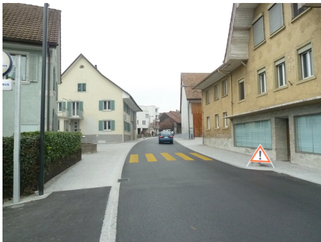
Fig. 9 : Hauptstrasse à Döttingen, 2008 (en haut), 2011 (en bas)