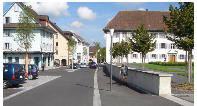
Fig. 2 : Marktstrasse à Muri AG avant les travaux, en 2005 (à gauche), et après, en 2006 (à droite)