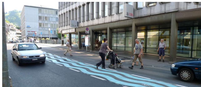
Fig. 8 : Bälliz, Thoun (BE)

Lors de l'aménagement d'une bande centrale polyvalente, celle-ci présentera une largeur idéalement de 2.50 m (largeur minimale: 2 mètres). Des éléments empêchant – au moins ponctuellement – le trafic motorisé d'utiliser la bande centrale seront installés aux points de traversées privilégiés ainsi qu'au droit des arrêts de bus. Des voies de circulation présentant une surlargeur ainsi que les bandes cyclables rendent la traversée libre plus difficile. On privilégiera une bande centrale ou des trottoirs plus larges s'il reste de l'espace à distribuer.