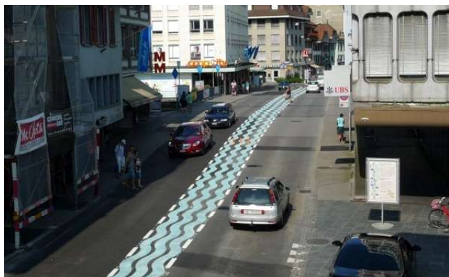
Fig. 4 : Bande centrale polyvalente « la vague bleue » aménagée de façon temporaire dans le cadre d'un essai (Bälliz, Thounne, BE)