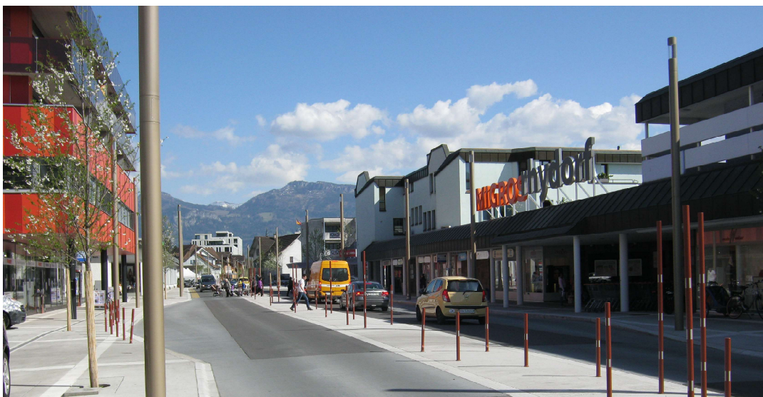
Fig. 1 : Bahnhofstrasse Widnau SG

Le présent aide-mémoire traite de l'efficacité et de l'opportunité d'aménager des zones de traversée libre dans les centres des localités en lieu et place de traversées ponctuelles avec passages pour piétons. Divers exemples réussis, tant en Suisse qu'à l'étranger, montrent que ce type d'aménagement peut être tout à fait adéquat. Cinq exemples avaient fait l'objet d'observations et d'enquêtes en 2006 dans le cadre du travail de recherche „Fussgängerstreifenlose Ortszentren“ (« Aménagement de centres de localité sans passages pour piétons »). La présente étude „Flächiges Queren in Ortszentren - langfristige Wirkung und Zweckmässigkeit“ (« Effets à long terme et pertinence de zones de traversée libre dans les centres de localité ») poursuit la recherche et porte cette fois sur dix exemples en Suisse.