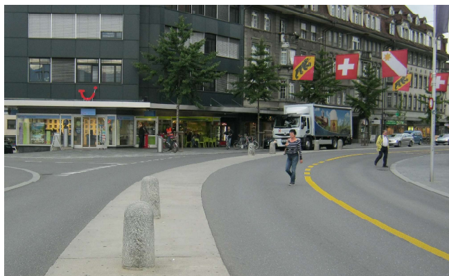
Fig. 5 : Des voies spéciales, par exemple des voies bus, rendent la traversée libre plus compliquée, mais ne sont pas un critère guillotine (Bahnhofstrasse, Thounne, BE)