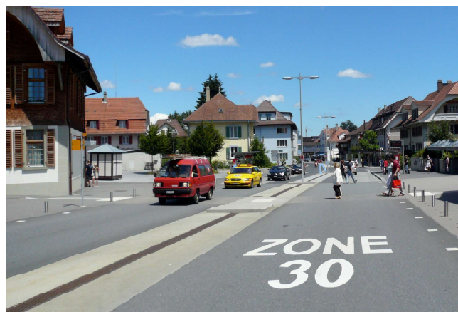
Fig. 6 : Des vitesses réduites facilitent la traversée libre (Köniz, BE)