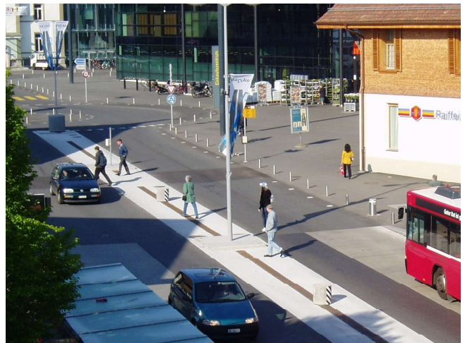
Fig. 3 : Piétons traversant là où ils le désirent (Köniz, BE)

La recherche a consisté en une étude de cas, analysés selon des méthodes relevant de la psychologie d'une part, et de la technique du trafic d'autre part. L'étude a porté sur dix situations caractérisées par un nombre élevé de piétons traversant la chaussée et par des charges de trafic relativement élevées, soit des situations dans lesquelles on pouvait espérer observer de nombreuses interactions entre véhicules motorisés (voitures et motocycles) et piétons. Au total, ce sont près de 20'000 interactions qui ont pu être analysées sous l'angle des conflits potentiels ou effectifs. Les conflits entre piétons et vélos n'ont pas fait l'objet d'une analyse spécifique, mais rien de spécial n'a été relevé.