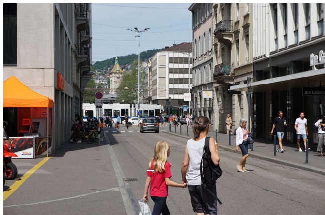
Fig. 7 : Löwenstrasse à Zurich.

Une largeur de six mètres environ a fait ses preuves pour des routes ayant une voie par sens sans bande centrale polyvalente. Des gabarits plus larges incitent à rouler plus vite et renforcent la position dominante du trafic motorisé par rapport aux piétons, de telle sorte que la coexistence des usagers risque de s'avérer problématique. En l'absence de bande centrale polyvalente, les piétons doivent traverser la chaussée en une fois ; ce type d'aménagement n'est donc envisageable que lorsque les charges de trafic ne sont pas trop élevées. Dans la mesure où les vitesses pratiquées sont faibles, il est possible d'aller jusqu'à 8'000 véh/j voire plus. Au-delà de 10'000 véh/jour, il est recommandé d'envisager une bande centrale polyvalente.